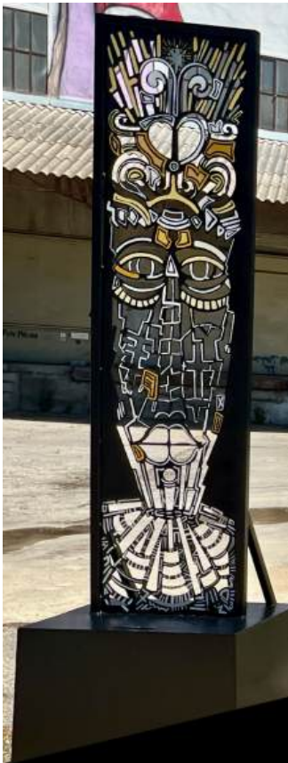
« Le Gardien ». Placide Zéphyr. Vue frontale. © A3-art, 2025.