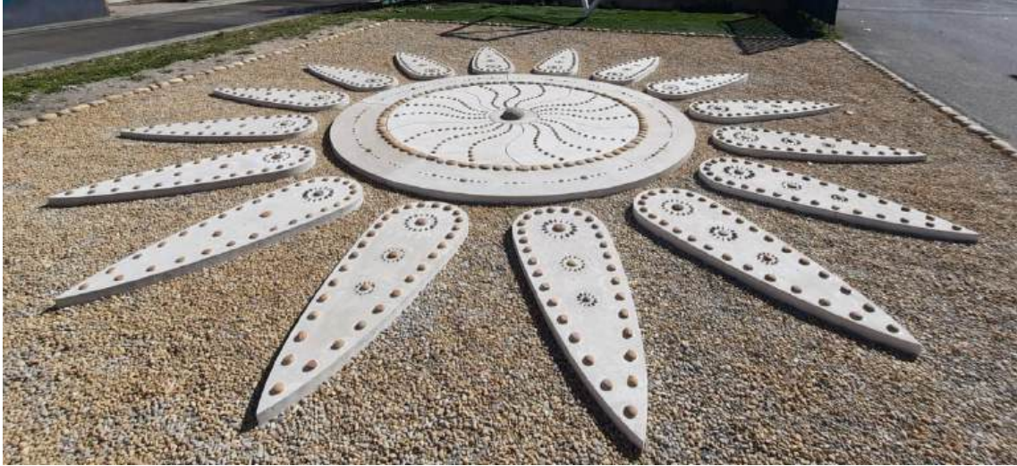
« Tournesol ». Yoann Crépin.