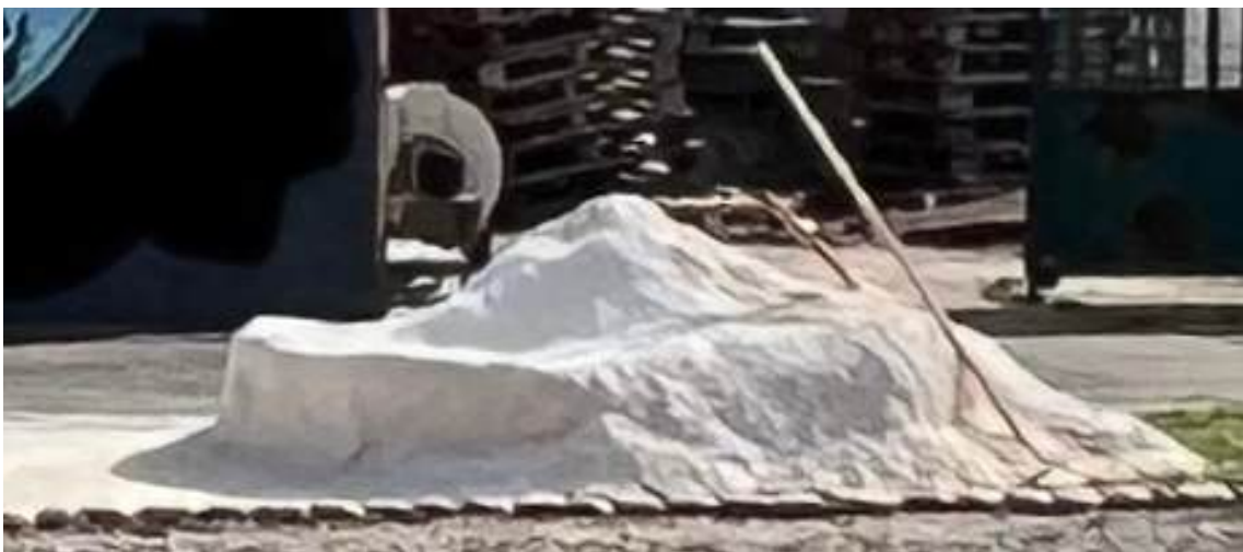
« Banc de sable ». Gilles Barbier. Vue frontale.